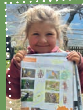
Thea di Parcines