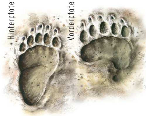
Zeichnung: Igor Pičulin

Wenn man einen Bären trifft, ist es vor allem wichtig, Ruhe zu bewahren und die Vorgangsweise an die jeweilige Situation anzupassen. Wenn der Bär einen Menschen entdeckt, kommt es in der Regel zu folgenden Reaktionen: