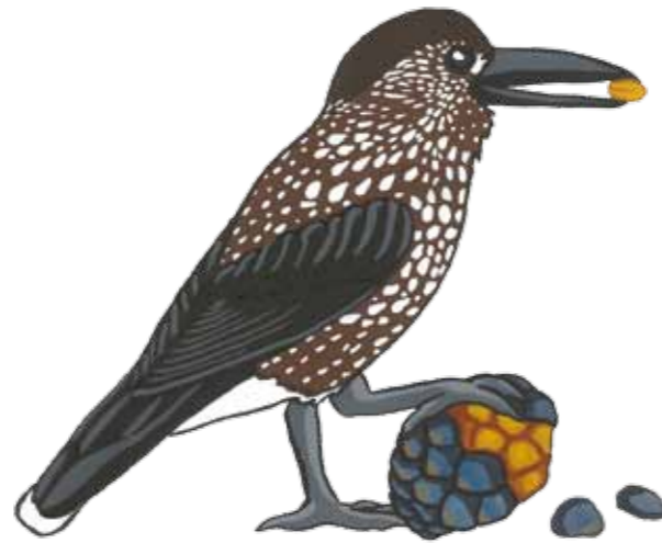
Wegen seiner Vorliebe für Zirbennüsse wird der Tannenhäher bei uns auch „Zirbngratsch“ genannt.

Der Tannenhäher hat ein schokofarbenes Gefieder mit weißen Tupfen und lebt in unseren Nadelwäldern. Besonders gut gefällt es ihm an der Waldgrenze . Hier findet er seine Lieblingsnahrung, die Nüsse der Zirbe . Diese pickt er jetzt im Herbst massenweise aus den reifen Zapfen. Bis zu 100.000 Nüsse sammelt der Vogel jedes Jahr! Sie dienen ihm als Nahrungsvorrat für den Winter.