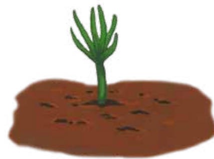
Der Tannenhäher ist wie ein fliegender Förster. Dank ihm wachsen neue Bäume.

Aber was passiert mit den Nüssen, die der Tannenhäher nicht wiederfindet? Aus einigen wachsen im nächsten Jahr kleine Bäumchen . Für die Zirbe ist der Tannenhäher also ein wichtiger Partner. Er sorgt dafür, dass sich dieser Baum gut ausbreiten kann und neue Bäume nachwachsen. Die Zirbe wiederum versorgt den Tannenhäher mit Nahrung. Dieses Zusammenspiel, bei dem beide Partner voneinander profitieren, nennt man Symbiose .