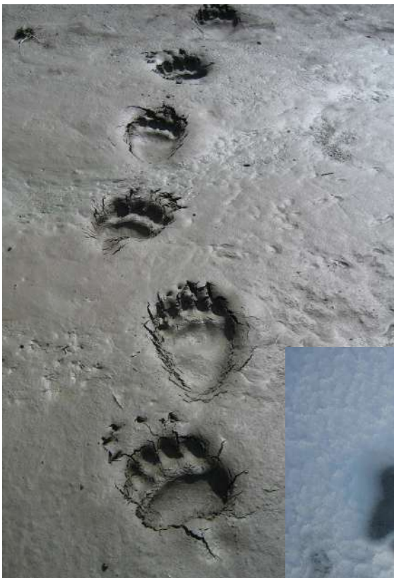
Fährte und Trittsiegel Bär